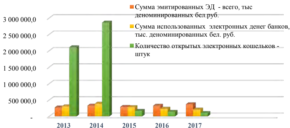
Рис. 2. Динамика рынка электронных денег Республики Беларусь за 2013–2017 гг.

Динамика эмиссии электронных денег в Республике Беларусь представлена на рис. 2 [2].