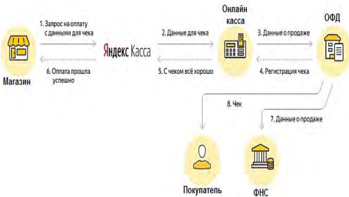
Рис. 1. Схема взаимодействия интернет-магазина с платежным агрегатором

Крупнейшим отечественным агрегатором является сервис Яндекс.Касса. Именно она первой предоставила сервис автоматической отправки цифровых чеков при подтверждении оплаты.