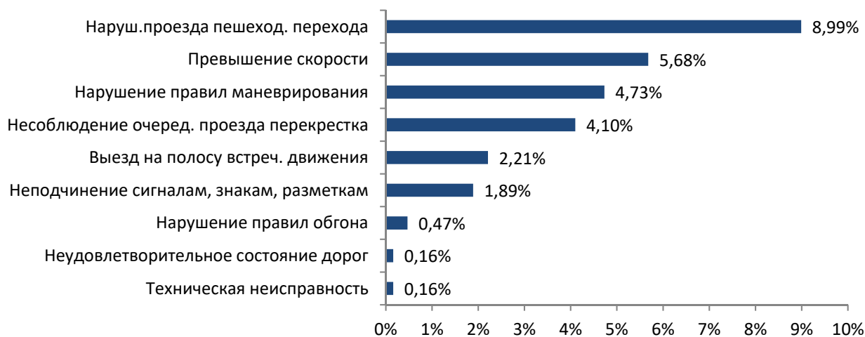
Рисунок 4 – Распределение ДТП по фактору организации движения

Большая часть аварий произошла на республиканских автомобильных дорогах, в областном центре и иных населенных пунктах.