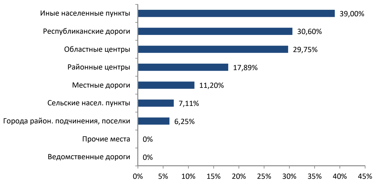
Рисунок 3 – Распределение ДТП по фактору места происшествия

нетрезвом состоянии, а 6% водителей скрылось с места ДТП. Высокой является и доля детского травматизма.