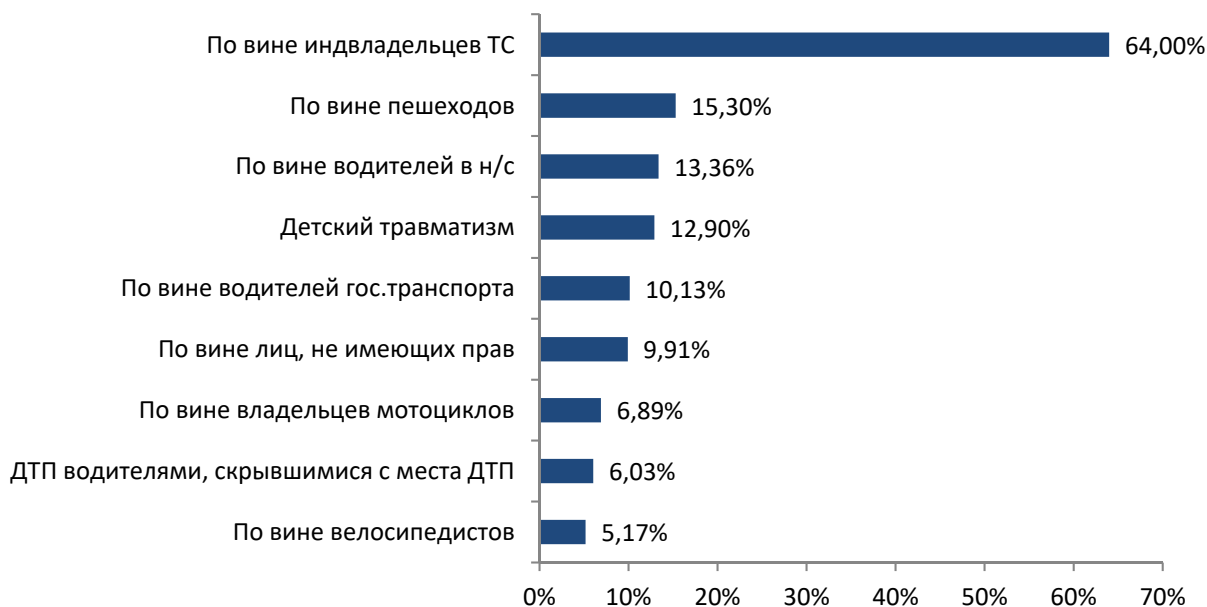
Рисунок 2 – Распределение ДТП по фактору участника

При общем анализе ДТП мы использовали типовую статистическую форму отчетности ГАИ УВД Могилевского облисполкома, которая насчитывает 117 показателей. Выявить наиболее опасные и проблемные зоны в ней очень сложно. Поэтому мы решили выполнить структуризацию общего количества ДТП за 2016 г. по четырем факторам: фактору вида ДТП, фактору места ДТП, фактору организации движения, фактору условий движения. Результаты представлены на рисунках 2, 3, 4, 5.