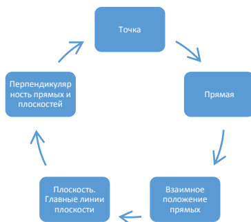
Рисунок 2. Тематика карт программированного контроля

В данной работе успешно используются разработанные тесты по начертательной геометрии, состоящие из графических и текстовых заданий, оформленных в виде карт программированного контроля по 15 вариантов для каждой темы. Графические задания и вопросы подбираются в результате анализа теоретического материала, изучаемого на лекционных и практических занятиях, в соответствии с выполняемой графической работой. По мере изучения темы сложность контролируемых вопросов возрастает. На рисунке 2 представлена тематика карт программированного контроля.